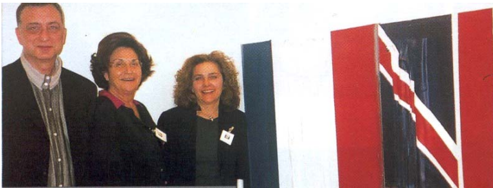
art athina 03 Helexpo | Athens