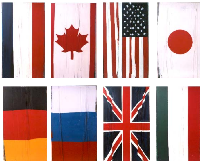
France | Canada | USA | Japan Germany | Russia | UK | Italy