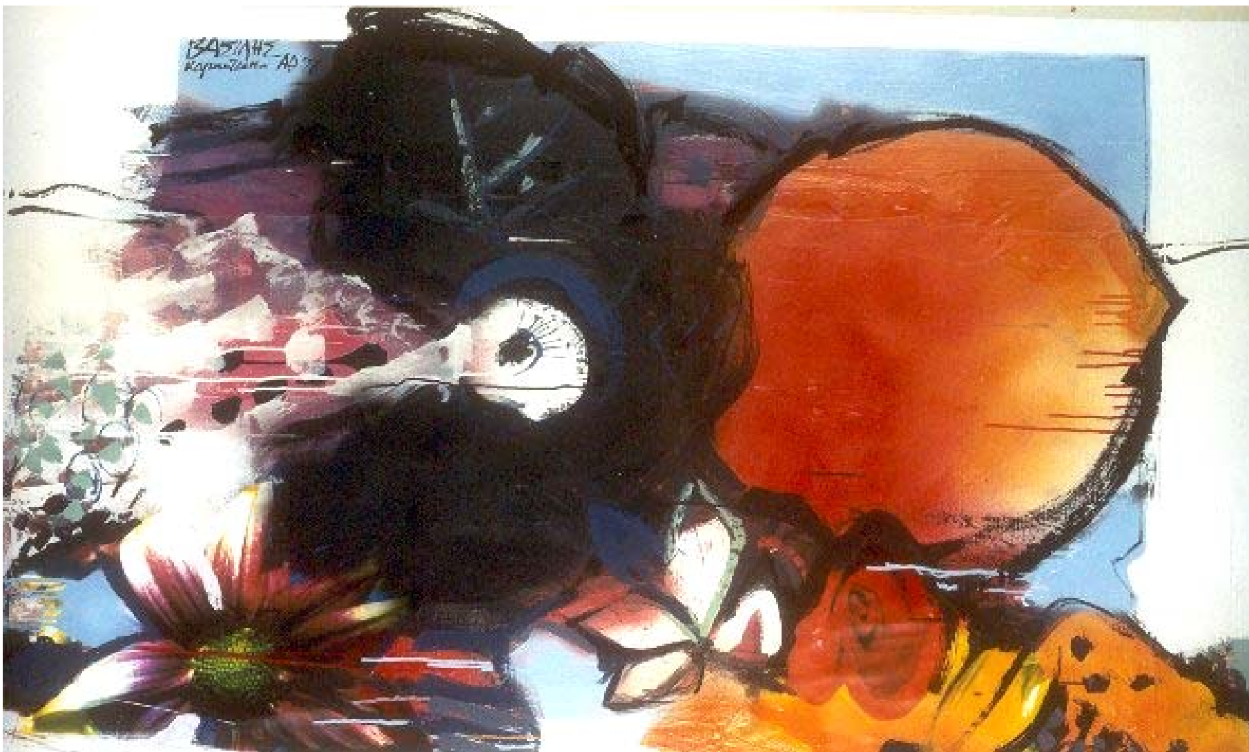
'Rosa hybrida', 1999 mixed media on canvas 090X180 cm. private collection, Limassol, Cyprus