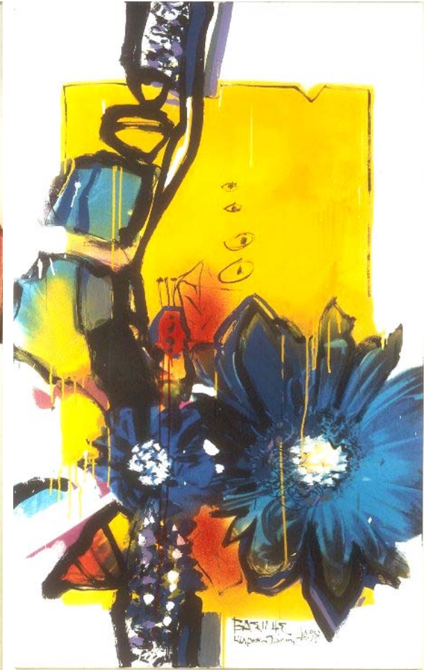
'Rosa hybrida', 1999 mixed media on canvas 180X085 cm. private collection, Limassol, Cyprus 'Rosa hybrida', 1999 mixed media on canvas 180X085 cm. private collection, Limassol, Cyprus 'Rosa hybrida', 1999 mixed media on canvas 180X085 cm.