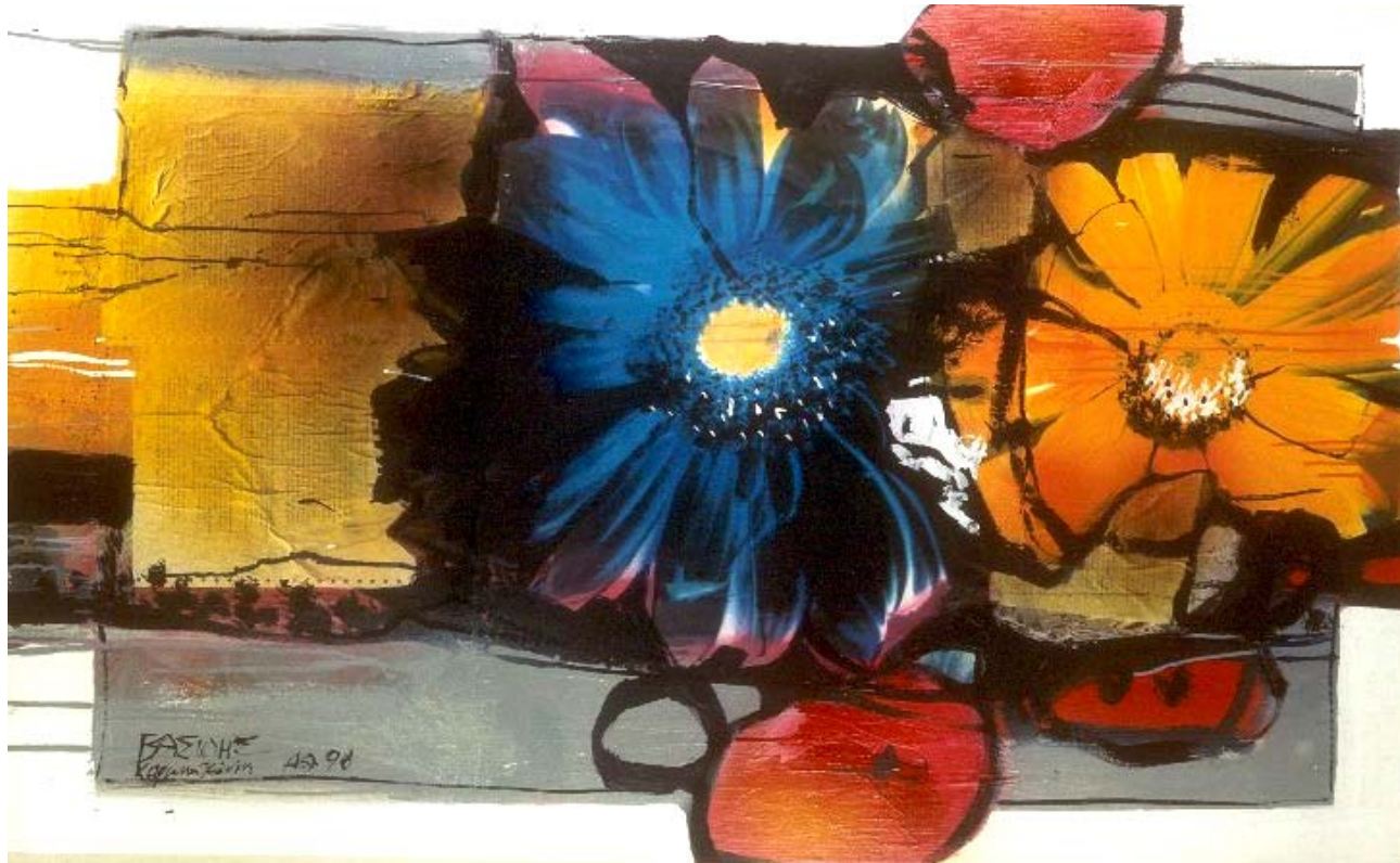
'Rosa hybrida', 1999 mixed media on canvas 085X180 cm. private collection, Nicosia, Cyprus